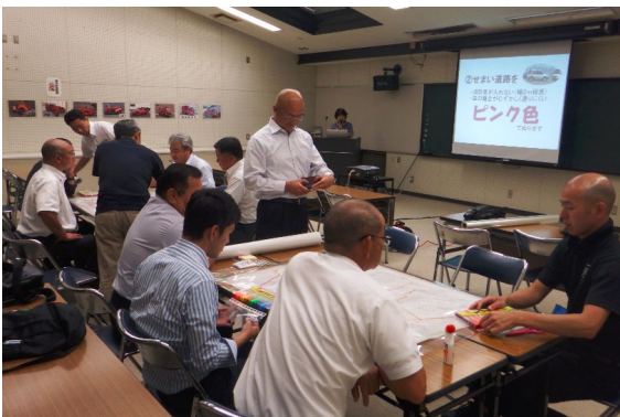
鹿児島県防災研修センター

今回は、桜島の監視体制や内容、地質や火山のメカニズム、避難体制についてなどをボランティアガイドの方に説明していただき、活発に質問や意見を交わし有意義な時間となった。